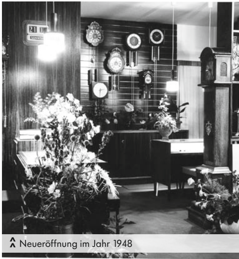
▲ Neueröffnung im Jahr 1948

Das Juweliergeschäft Fritz Krause GmbH glänzt durch hohe Handwerkskunst gepaart mit moderner Kreation bereits in dritter Generation.